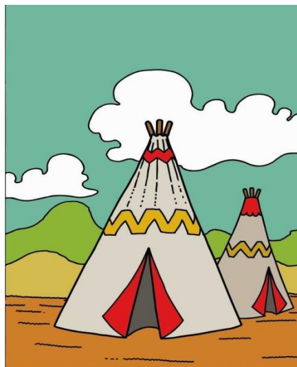
To jest Indianka. Mieszka w tipi.