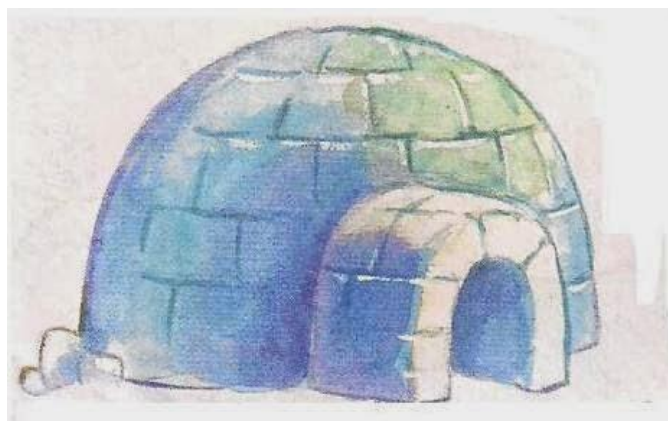
To jest Eskimos. Mieszka w igloo.