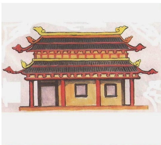
To jest Japonka. Mieszka w mince.